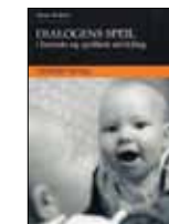
Dialogens Speil i barnets og språkets utvikling Stein Bråten, Abstrakt forlag 2007